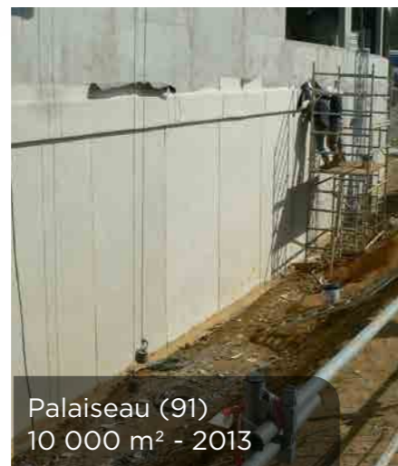
Palaiseau (91) 10 000 m 2 - 2013