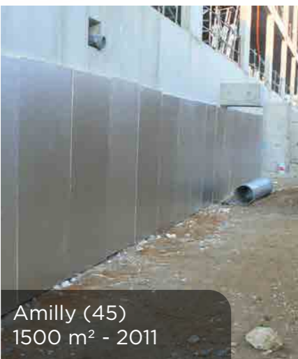
Amilly (45) 1500 m 2 - 2011