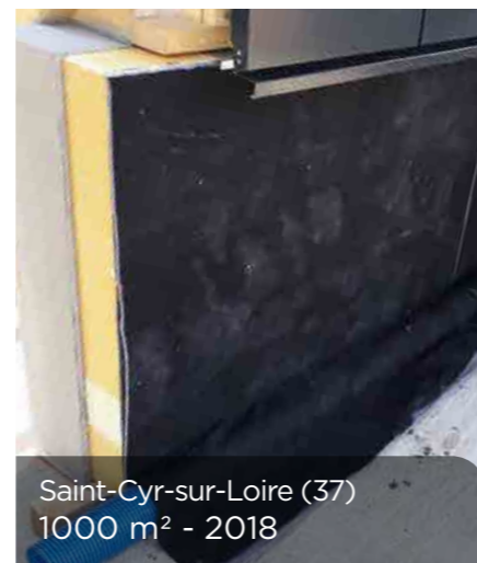
Saint-Cyr-sur-Loire (37) 1000 m 2 - 2018