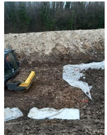
Remblaiement sur les géogrilles et compactage au pied de mouton sur sol fin