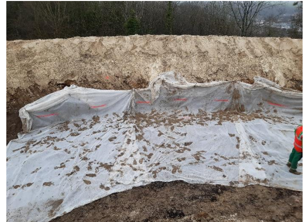
Décassement des talus existant, préparation et mise en place des boudins de géogrille