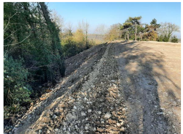
Plateforme existante avant extension